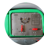
Panel Centralizador de Válvulas PRO